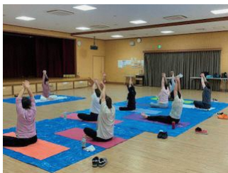
▲令和7年6月10日(火) 第1回 交流会 やすらぎヨガ