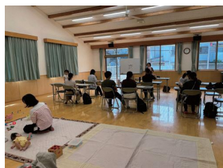
令和7年10月8日(水) ▶ 依頼会員説明・登録会 (ひなたぼっこ共催)

令和8年度も色々なイベントの開催を予定しています。広報じょうようや城陽市子育て支援サイトJOY♡KIDSにてお知らせいたしますので、ご参加ください。