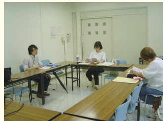
令和7年度講習会の様子

援助会員講習会は、およそ3時間の講習で、新規の援助会員または両方会員が、援助をするときに必要な子どもの安全面、健康面、発達面などの知識や緊急時の対処法などについて、資格を持った講師から学びます。ファミサポの活動に興味のある人は、ぜひご参加ください。